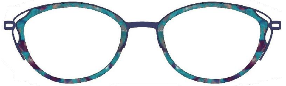
New model MJ-5047-2 48-19-138-36

アセテートの薄板とベータチタンの薄板を一つ一つ職人の手で ロー付け無しで 組付け 超軽量のコンビネーション 抜群の軽さと しなやかな掛け心地