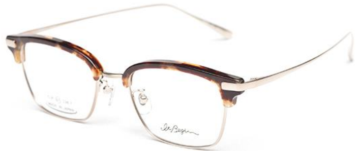
こだわりのセルロイドとチタン(F)