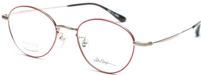
トレンド的な 大きい(52)ポストン