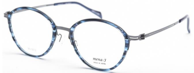
トレンド的な大き目(52)のポストン

薄プラリムと薄βチタンのシートのコンビネーション 超軽量で しなやか 掛け心地 抜群